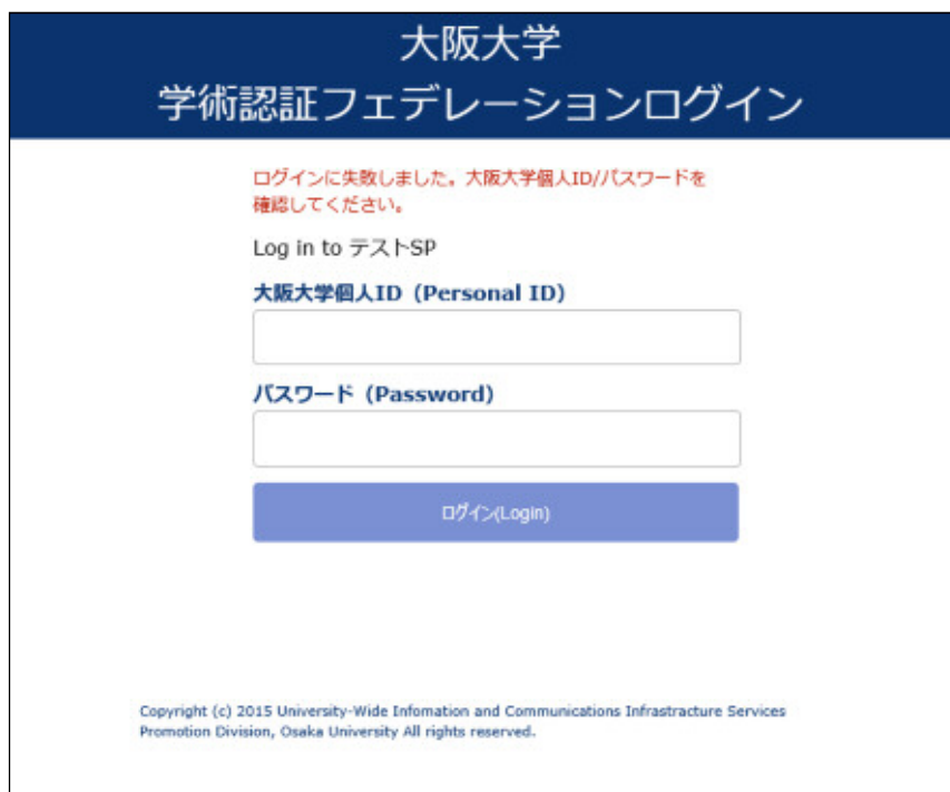
図 3 ログイン失敗の画面

誤った『大阪大学個人 ID』または『パスワード』を入力した場合、エラーメッセージが表示されます(図 3)。再度、『大阪大学個人 ID(Personal ID)』、『パスワード(Password)』を入力してください。